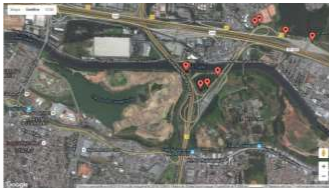
Chegada no Destino