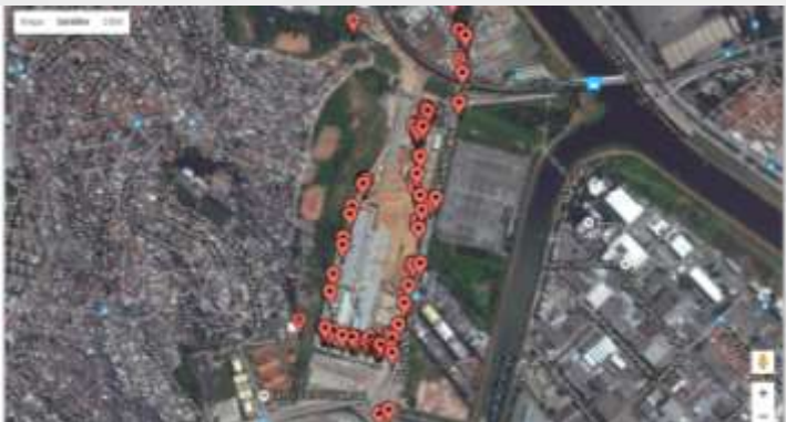
Saída da Origem